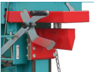
Optimal zum Fixieren der Stämme