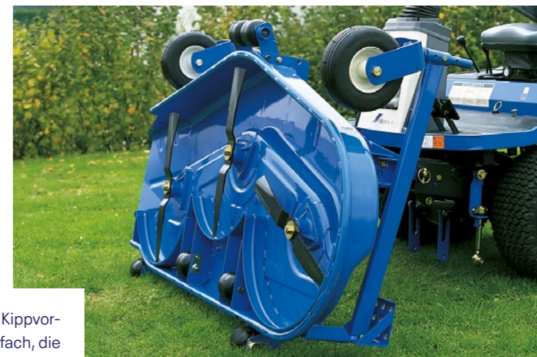
Die leichtgängige Kippvorrichtung macht es einfach, die Messer regelmäßig zu schleifen und die Maschine zu warten.

Im professionellen Alltag ist schnelles Warten keine Frage der Bequemlichkeit, sondern der Effizienz.