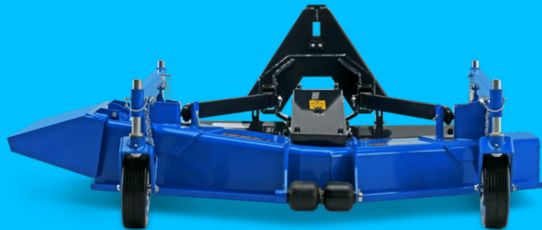
FM 160 PRO-S