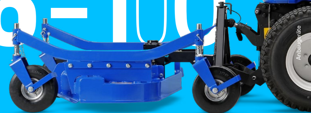
FM 130 PRO-S