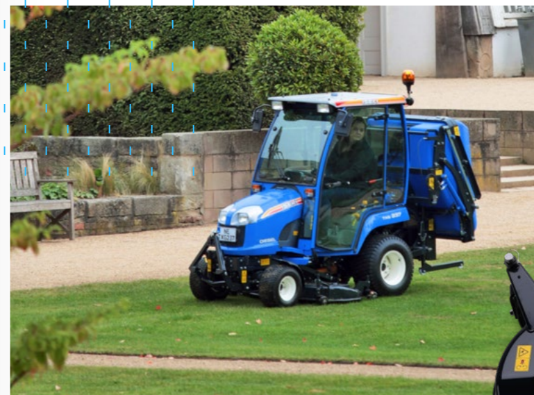
Im Einsatz schnell, gründlich, wendig – Mähwerke von ISEKI.